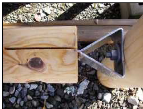
間伐材EMジョイントビーム